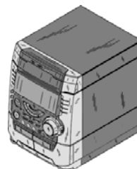
Aparato de Música 250